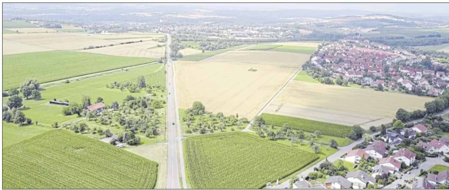
Auf dieser Fläche rechts der Straße könnte das zukunftsweisende Baugebiet entstehen.