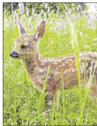
Ein Kitz in einer Wiese.

BIETIGHEIM-BISSINGEN (p). Am Dienstag (3. März) läuft diese Dokumentation „Die Wiese – Ein Paradies nebenan“ im Rahmen von „Kaffee, Kino und mehr ...“ um 15.30 Uhr im Olympia-Kino in Bissingen. Nirgendwo ist es so bunt, so vielfältig und so schön, wie in einer blühenden Sommerwiese. Hunderte Arten von Vögeln, Heuschrecken, Zikaden und anderen Tieren leben zwischen den Gräsern und farbenprächtig blühenden Kräutern der Wiese. Eine faszinierende Welt, in der ein Drittel der hiesigen Pflanzen- und Tierarten zu Hause ist. Bevor es zu