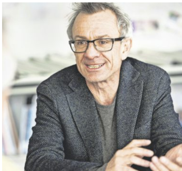
Als Intendant der Internationalen Bauausstellung (IBA) 2027 Stadt-Region Stuttgart verantwortet Andreas Hofer das größte Gemeinschaftsprojekt in unserem Ballungsraum. Die Erwartungen sind groß. Der 1962 in Luzern geborene Architekt geht sie mit einer typisch schweizerischen Mischung an: bedächtig und zielstrebig. DUD