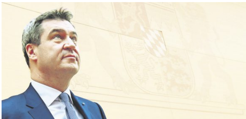
Seit Markus Söder bayerischer Ministerpräsident ist, macht er eine bemerkenswerte Wandlung durch: Aus dem Sprücheklopfer und Rechtsausleger wurde ein staatsmännisch-moderater Regierungschef. Ambitionen auf noch höhere Ämter weist er von sich – aber der Franke ist aktuell die stärkste Figur der Union und wird bereits als möglicher Kanzlerkandidat für die Bundestagswahl gehandelt. PÖ