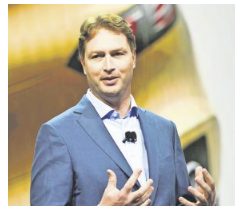
Kräftigt die Kosten senken, Stellen abbauen und gleichzeitig wegen der EU-Klimaziele deutlich mehr E-Autos verkaufen – eine schwere Aufgabe für Daimler-Chef Ola Källenius. SÖ