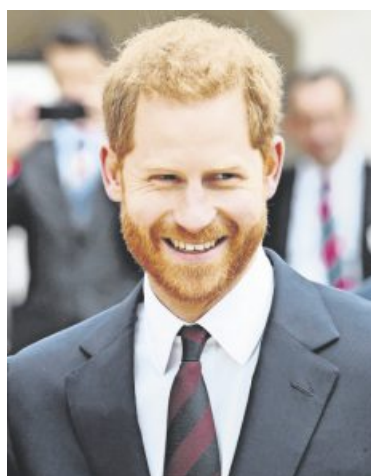
Der Skandal um Prinz Andrew hat das Image der Windsors schwer beschädigt. Prinz Harry könnte derjenige sein, der dem System, in dem solche Ungeheuerlichkeiten einfach ausgesessen werden, den Rücken kehrt und nach Afrika oder in die USA auswandert. SDR