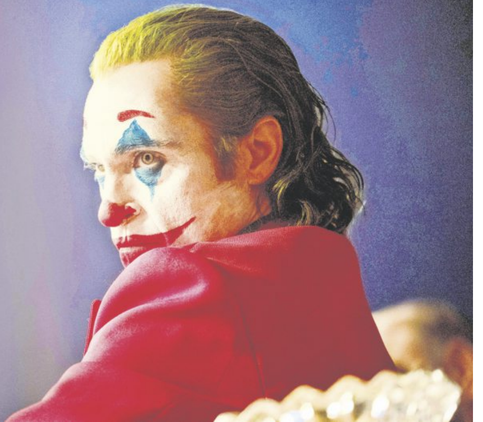
Seine Schauspielleistung als „Joker“ im gleichnamigen Kinofilm hat 2019 neue Maßstäbe gesetzt: Joaquin Phoenix. Und deswegen gibt es am 9. Februar 2020 in Los Angeles einen Oscar für ihn. Wetten?

Was ist das Schönste am Jahreswechsel? Zu mutmaßen, was wohl das neue Jahr bringt. In dieser Beilage haben wir Menschen des Jahres 2019 porträtiert. Zum Schluss schauen wir auf dieser Seite nach vorne, welche Menschen das kommende Jahr prägen könnten.