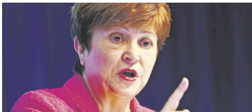
Die Bulgarin Kristalina Georgieva vertritt als Chefin des Internationalen Währungsfonds (IWF) 189 Staaten. Die USA und ihr Finanzbeitrag sind für den IWF besonders wichtig. Denn in den konjunkturell mauen Zeiten werden einige Länder IWF-Hilfen benötigen. Georgieva muss also den wankelmütigen Donald Trump bei Laune halten, der aber setzt auf Abschottung der USA. Ein Balanceakt für die seit Oktober amtierende IWF-Chefin. SÖ