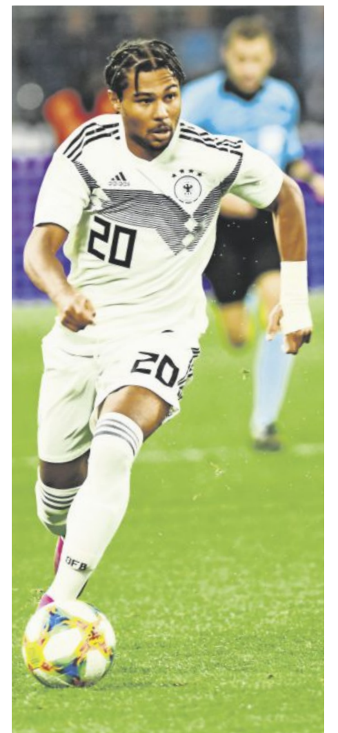
Serge Gnabry spielt immer, das hat Bundestrainer Joachim Löw so beschlossen. Serge Gnabry spielt also auch bei der EM 2020 – und ist nach seinen 13 Toren in 13 Länderspielen der große deutsche Hoffnungsträger.