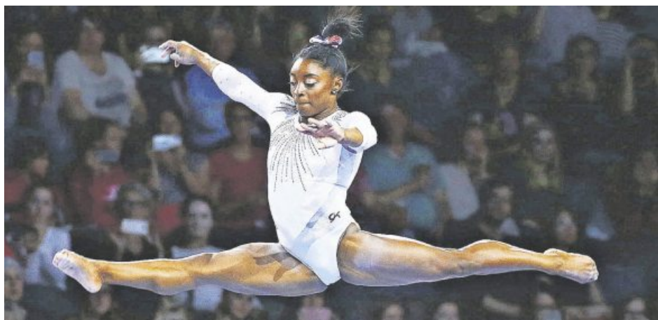
Geht da noch mehr? US-Turnerin Simone Biles (22) holte bei der WM in Stuttgart fünfmal Gold. Mit 25 WM-Medaillen ist sie die erfolgreichste Turnerin der Geschichte. Vier olympische Goldmedaillen hat die Jahrhundertathletin schon in der Tasche – die Sommerspiele 2020 in Tokio werden wohl die nächsten Biles-Festspiele. SEM