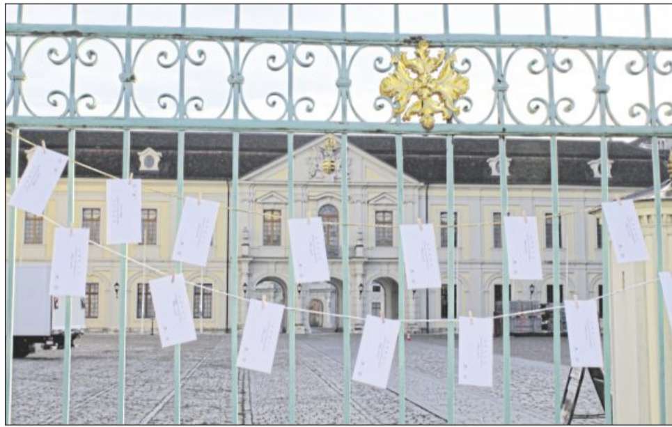
Auch am Gitter zum Schlosshof des Ludwigsburger Residenzschlosses hängen immer samstags und sonntags Zettel mit Geschichten und Geschichtchen zum Mitnehmen.

Ein Stück Ausstellung kann in Form von Postkarten gegen eine Spende bei Kinder- und Jugendtrauer des Kinderhospizdienstes erworben werden. Bestellungen sind per E-Mail an kinderundjugendtrauer.lb@hospiz-bw.de oder unter der Telefonnummer 0 71 41 / 99 24 34 44 möglich.